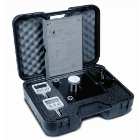
Maletín de transporte, dimensiones 465 x 370 x 175 mm